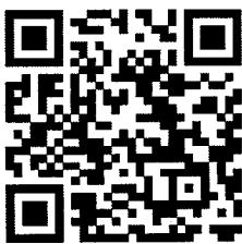
รายงาน รบจ.๑

นักวิชาการสาธารณสุขชำนาญการพิเศษ หัวหน้ากลุ่มบริหารนโยบายยุทธศาสตร์และประเมินผล