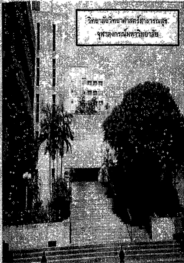
วิทยาลัยวิทยาศาสตร์สาธารณสุข จุฬาลงกรณ์มหาวิทยาลัย

• ต้นทุนจัดดำเนินการ ส่งมอบสิทธิบัตรในต้นตางทะเบียนที่ชำระ-ขึ้นทะเบียนเป็นผู้เข้าร่วม อบรมแล้ว ด้วยอัตราค่าบริการ ค่าใช้จ่ายต่างๆ ตามยอดผู้ลงทะเบียน ซึ่งชำระ ค่าลงทะเบียน