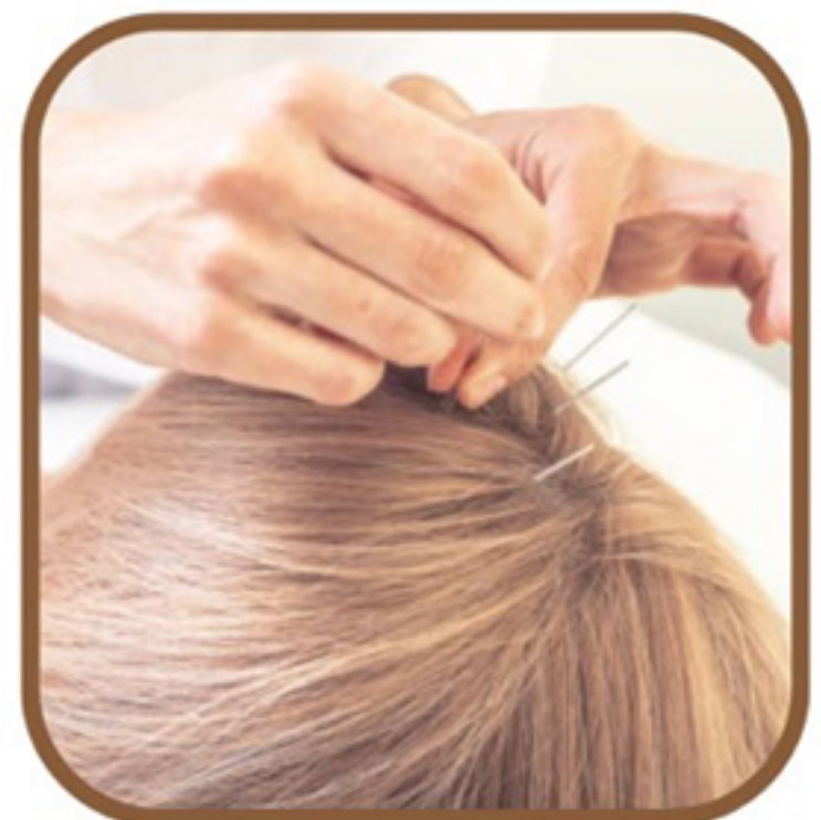
ฝังเข็มความงาม