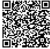
QR code บันทึกแจ้งความประสงค์

๓. แจ้งความประสงค์จัดทำบันทึก ขออนุมัติเข้าร่วมการประชุมฯ ดาวน์โหลดเอกสาร ผ่าน QR Code