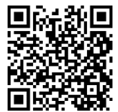
QR code รายงานสรุป การประชุม/อบรม/สัมมนา

๘.ผู้อำนวยการพิจารณาอนุมัติ เผยแพร่รายงานสรุป การประชุม / อบรม/สัมมนา ผ่านเว็บไซต์ สสม.