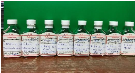
ชุดตรวจเชื้อโคลิฟอร์มแบคทีเรียในภาชนะสัมผัสอาหาร อ. 13