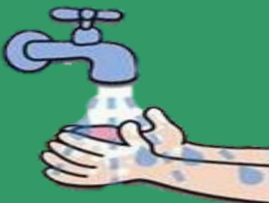
ล้างมือบ่อยๆ