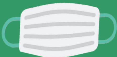
สวมหน้ากาก